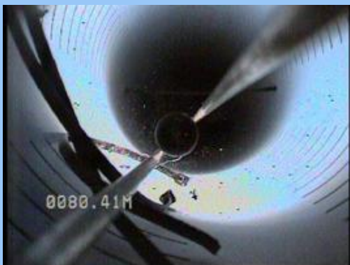
Entubación de PVC-U