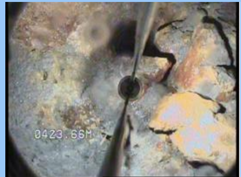
Derrumbe de sondeo sin entubar