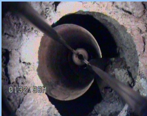
Rotura del entubado